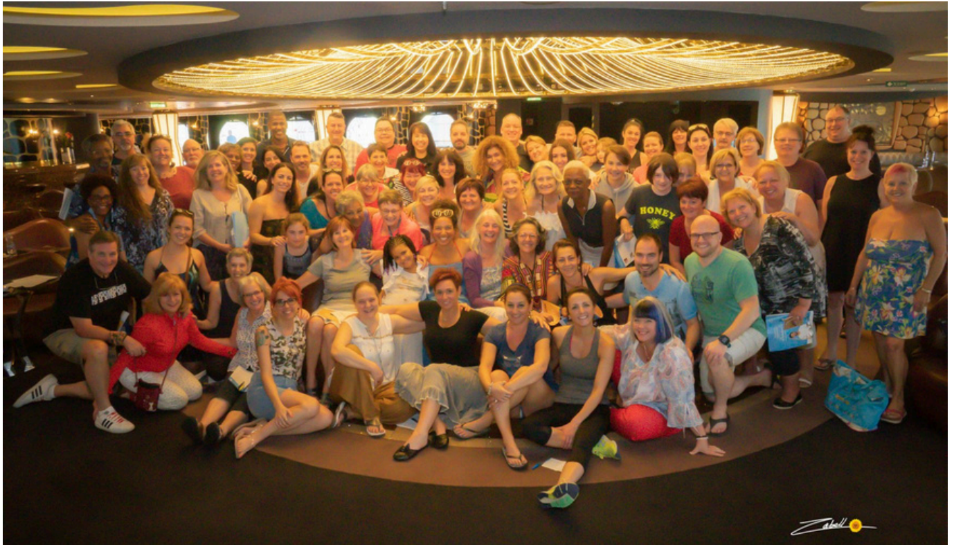
Enseignants et participants lors de la croisière-séminaire de février 2020